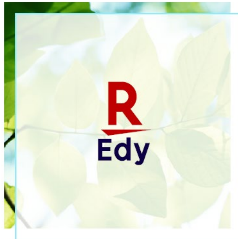
写真の上に70-90%の白色の調整レイヤーを使用