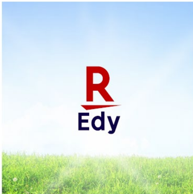
ロゴ周辺のトーンを明るく調整した写真

視認性の悪い「写真」または「写真以外のイメージ」に楽天Edyロゴを配置する場合は、透明度70-90%の白色の調整レイヤーを引いた上に配置してください。